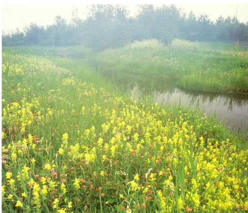
Foto 3: Een natuurlijk riviertje midden in de stad als alternatief voor het versteende, statische stadsbeeld.

Het initiatief voor natuurontwikkeling kan van de groenafdeling van de gemeente komen, maar het vastleggen voor de toekomst vraagt om een integrale aanpak samen met de overige gemeente afdelingen die zich met het beheer van de openbare ruimte bezighouden, als ook externe instanties als het waterschap Regge en Dinkel en overige grootgrondbezitters in de stedelijke invloedssfeer van Almelo.